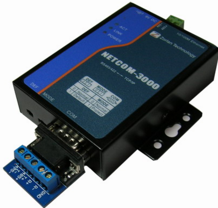
图 1 NETCOM3000 串口服务器

NETCOM3000 是一款高性价比的串口服务器，RS422 接口支持全双工、不间断通信，内嵌 485 防雷保护，支持 DHCP、DNS，可轻松实现异地远程设备监控。支持虚拟串口，原有串口 PC 端软件无需修改。