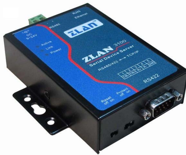
图 1 ZLAN3100 串口服务器

ZLAN3100 是一款高性价比的串口服务器，RS422 接口支持全双工、不间断通信，内嵌 485 防雷保护，支持 DHCP、DNS，可轻松实现异地远程设备监控。支持虚拟串口，原有串口 PC 端软件无需修改。